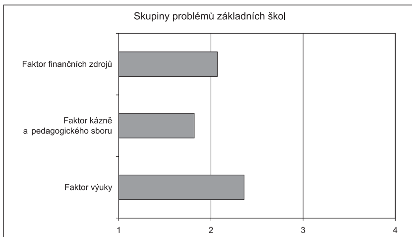
Graf č. 3.5 Hodnocení jednotlivých obecných skupin problémů (faktorů) (Aritmetické průměry sumačních indexů sestavených na základě faktorové analýzy)

Pozn.: Jde o aritmetické průměry vypočítané z 4bodové škály.